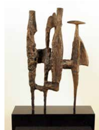
Arnold Haukeland Amerikanere i Paris 1960 Bronse