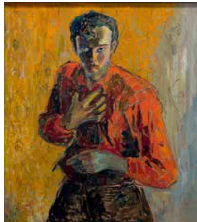
Edvard Vigebo Teatralsk 1939 Olje på lerret