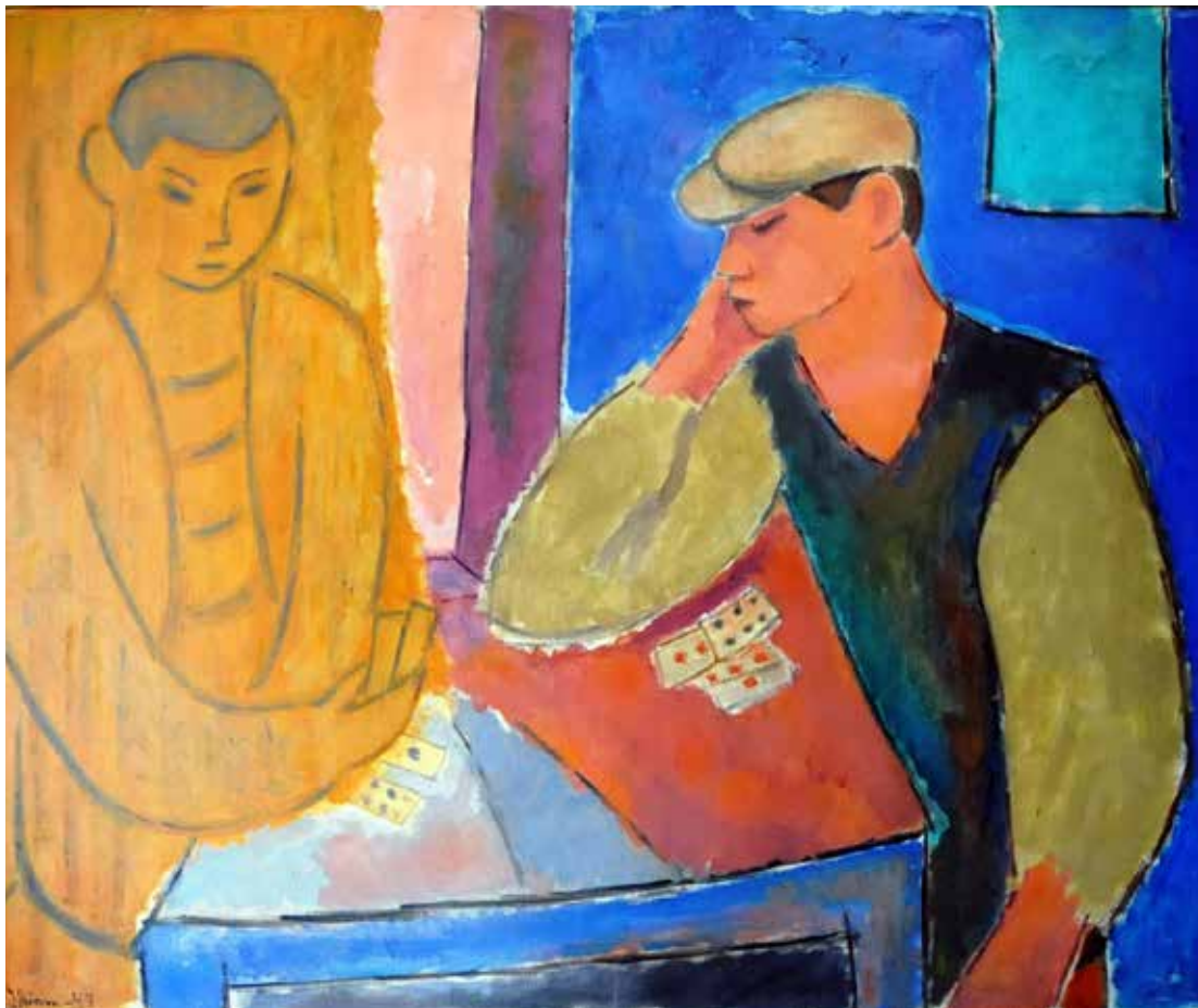
Johs. Rian Kortspill 1947 Olje på lerret