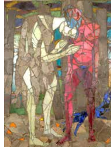
Sigurd Winge To mennesker (demring) 1946 Mosaikk i glass og skifer