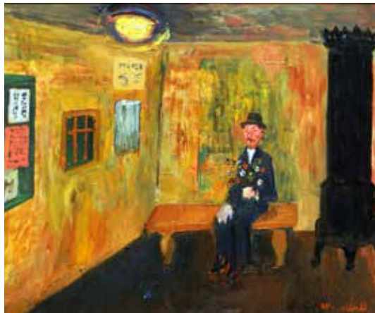
Reidar Aulie På venteværelset 1948 Olje på plate