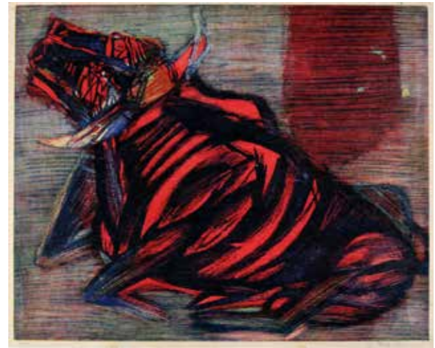
Knut Rumohr Liggende okse 1954 Tresnitt