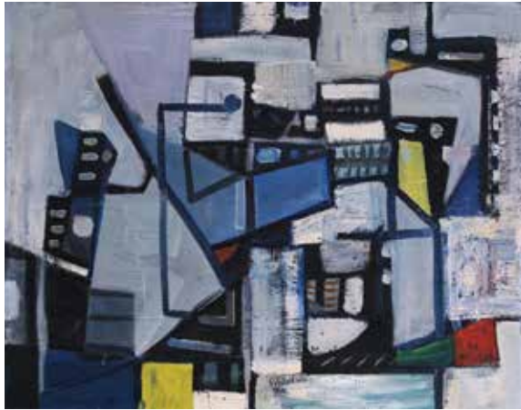
Jakob Weidemann Komposisjon 1949 Olje på plate