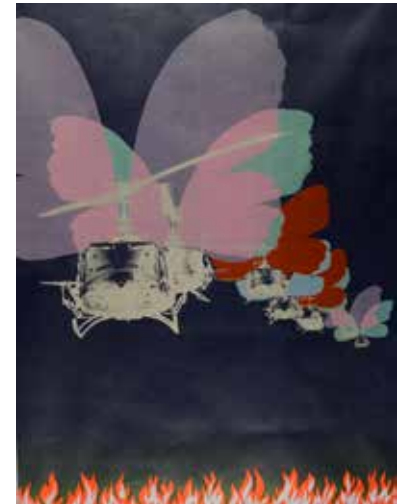
Per Kleiva Amerikanske sommarfuglar 1971 Serigrافي