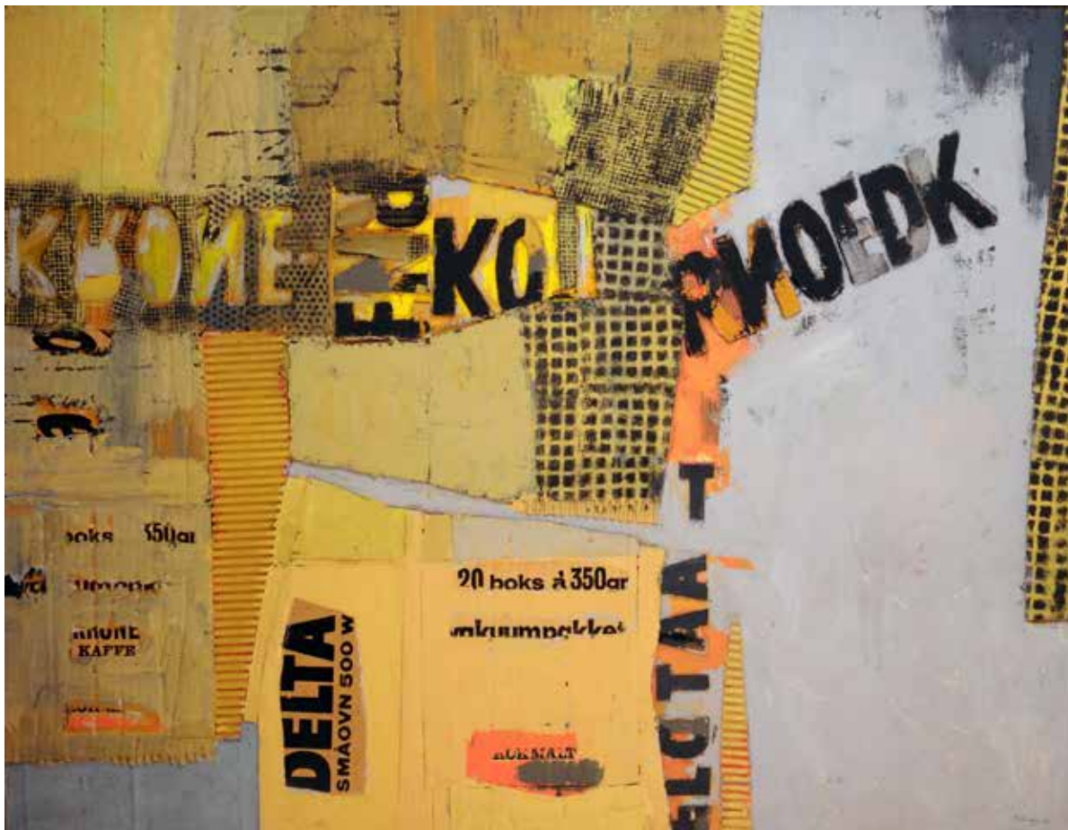
Morten Krohg Komposisjon 1965 Plastlim og collage på lerret