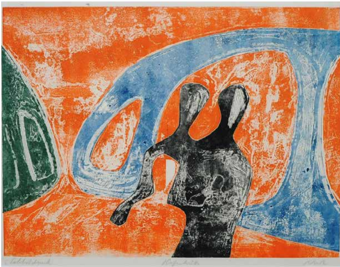
Rolf Nesch Havnebro 1932 Koldnål og akvatint