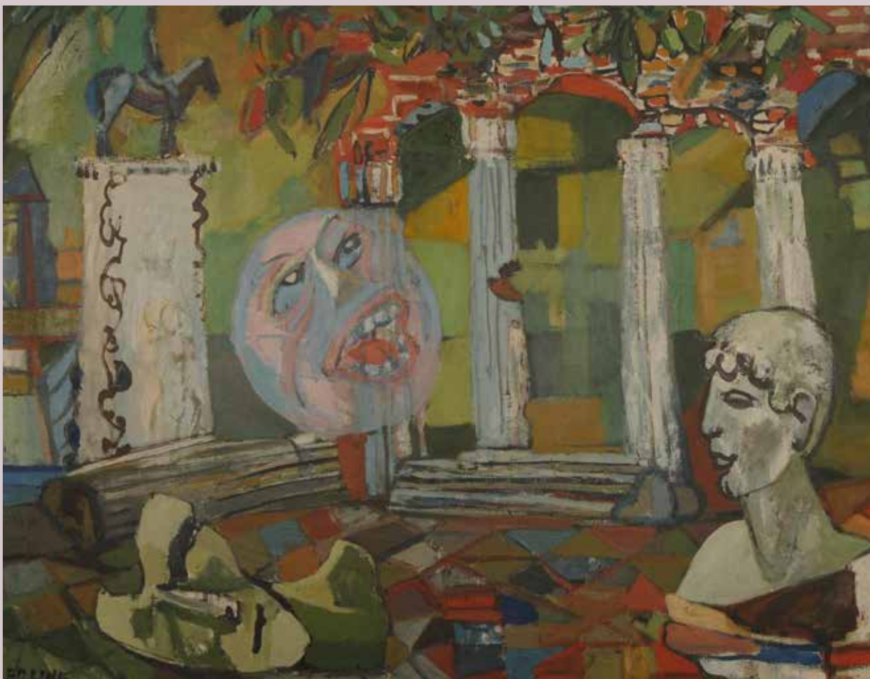
Erling Enger Guidens stemme 1948 Olje på lerret