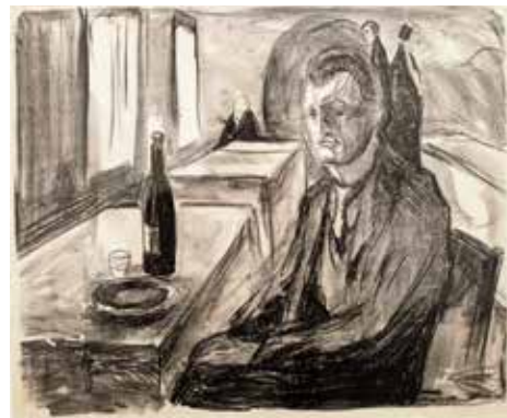
Edvard Munch Selvportrett i restaurant U.d. Litografi