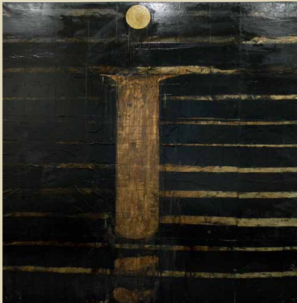
Kjell Nupen Hjemsted (Måneskinn til E.M.) 1991-99 Blandet teknikk