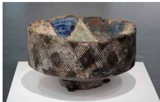
Grete Nash Seremonikar 1990 Raku