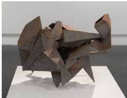
Dagfin Kjølrsrud Farlig dyr 1965 Sveiste stålplater