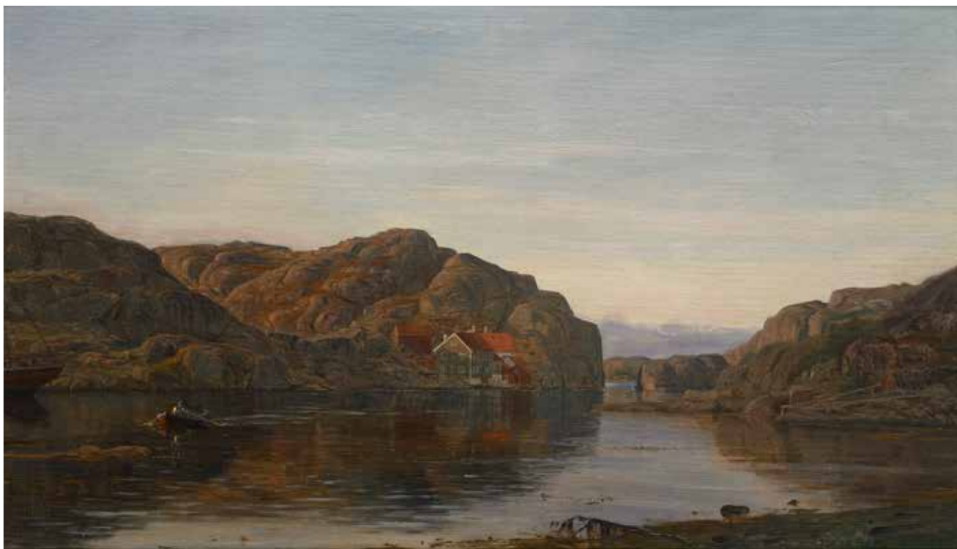
Amaldus Nielsen Morgen i Ny-Hellesund 1881 Olje på lerret