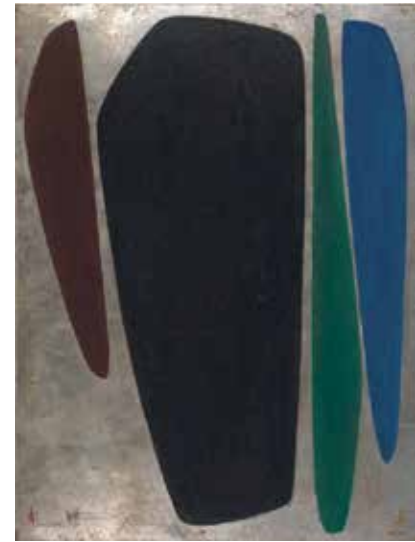
Anna-Eva Bergman Uten tittel 1955 Olje og sølvfolie på plate