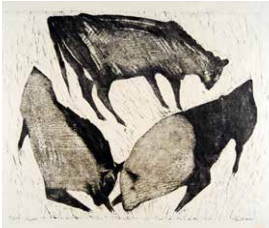
Ludvig Eikaas Oksekamp U.å. Tresnitt