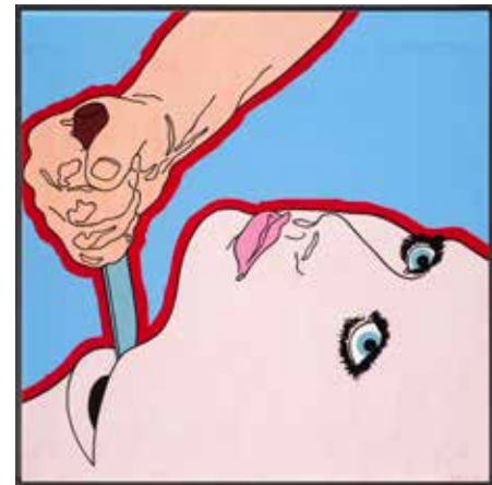
Per Kleiva Den amerikanske angsten 1971 Olje på lerret