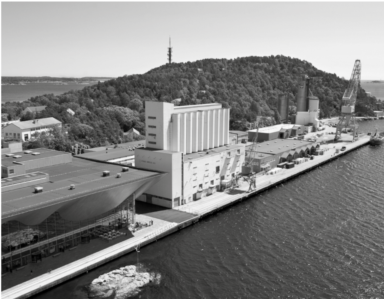
Silokaia, 2016